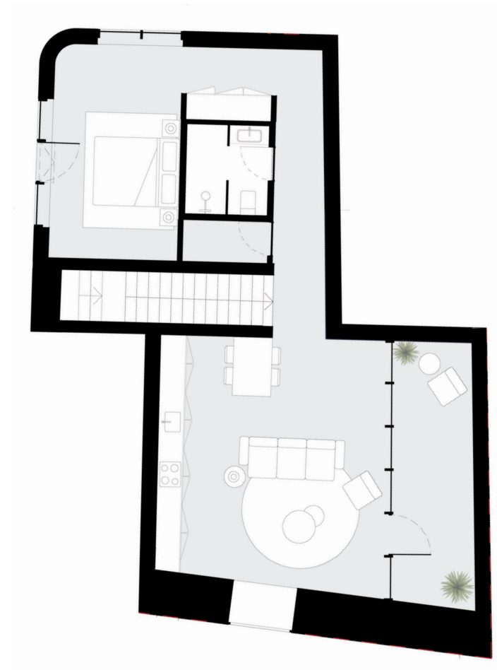
PISO 1 floor 1