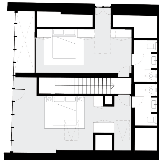
PISO 3 floor 3