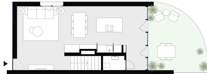
PISO 0 floor 0