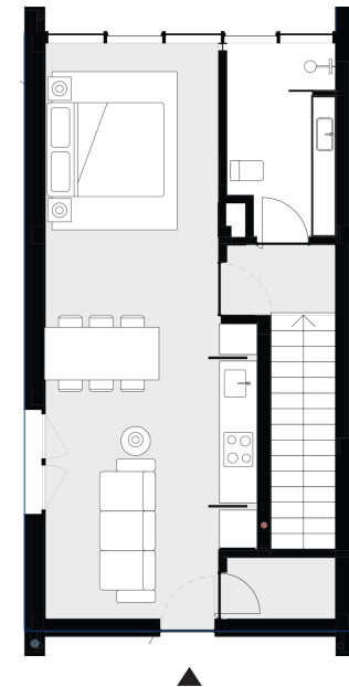
PISO 0 floor 0