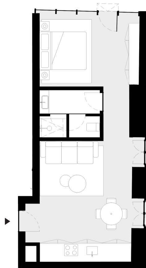
PISO 1 floor 1