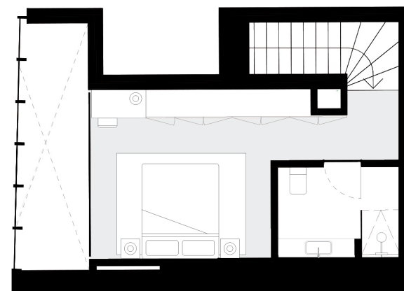
PISO 2 floor 2