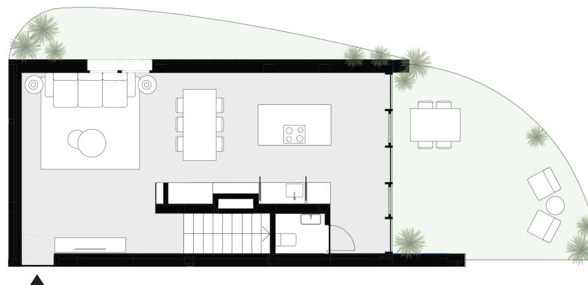
PISO 0 floor 0