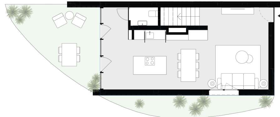
PISO 0 floor 0