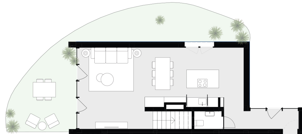
PISO 0 floor 0