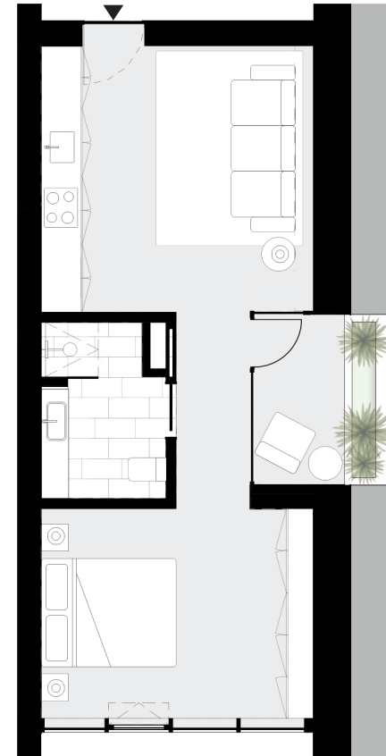
PISO 3 floor 3