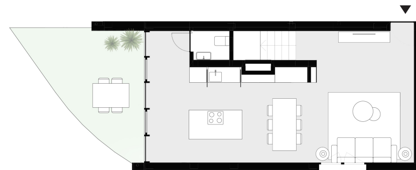
PISO 0 floor 0