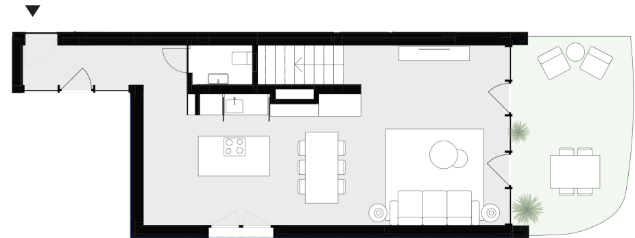
PISO 0 floor 0