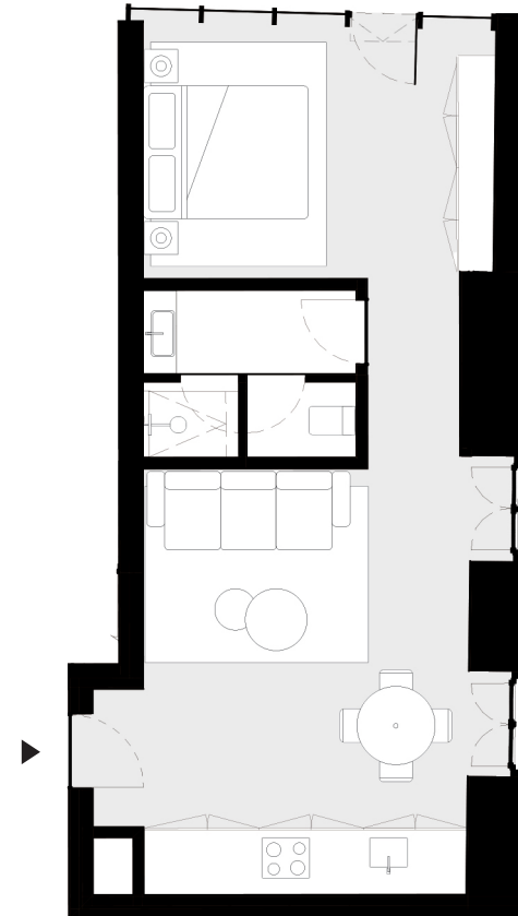
PISO 1 floor 1