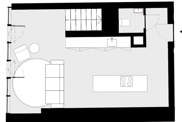
PISO 1 floor 1