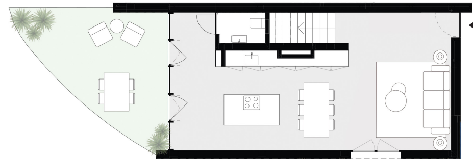
PISO 0 floor 0