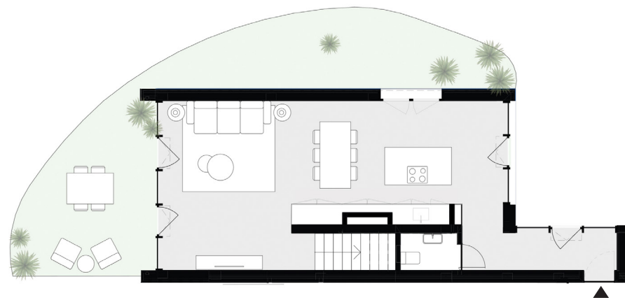
PISO 0 floor 0