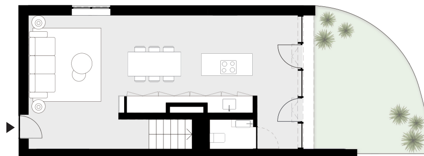
PISO 0 floor 0