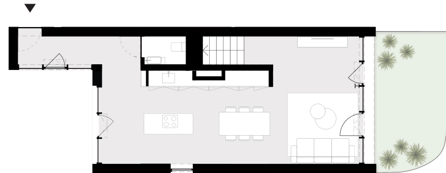
PISO 0 floor 0