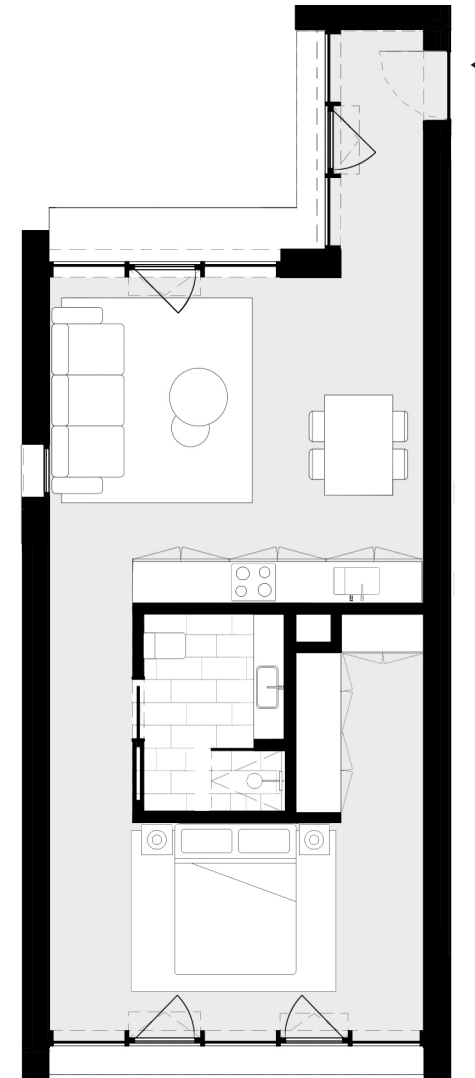
PISO 2 floor 2