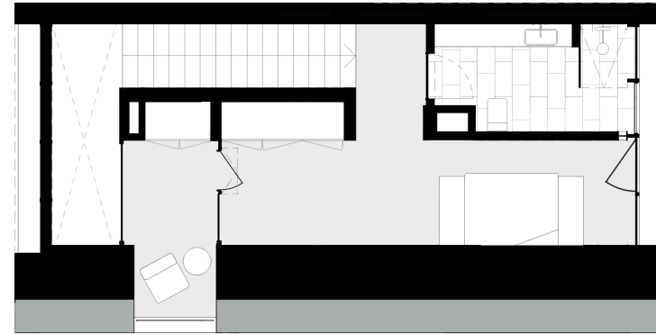
PISO 2 floor 2