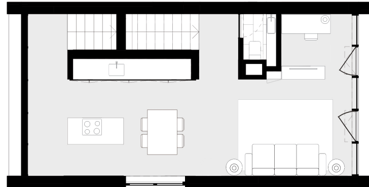
PISO 1 floor 1