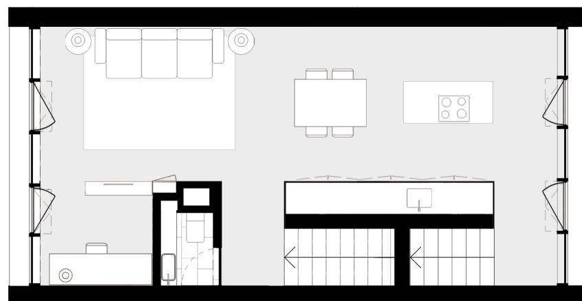
PISO 1 floor 1