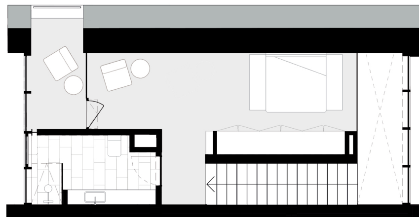
PISO 2 floor 2