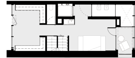
PISO 2 floor 2