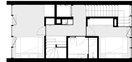
PISO 1 floor 1