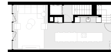
PISO 0 floor 0