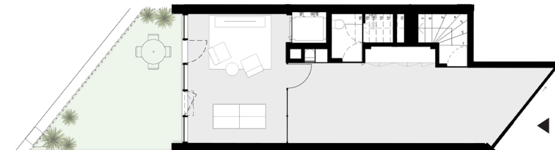
PISO -1 floor -1